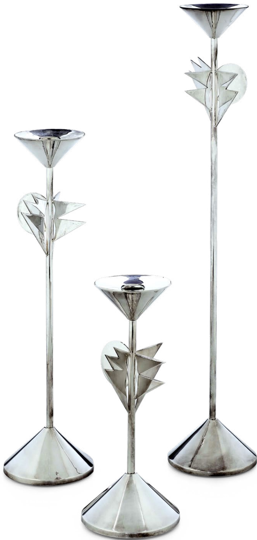
ARGENTI DA COLLEZIONE DEL XX SECOLO