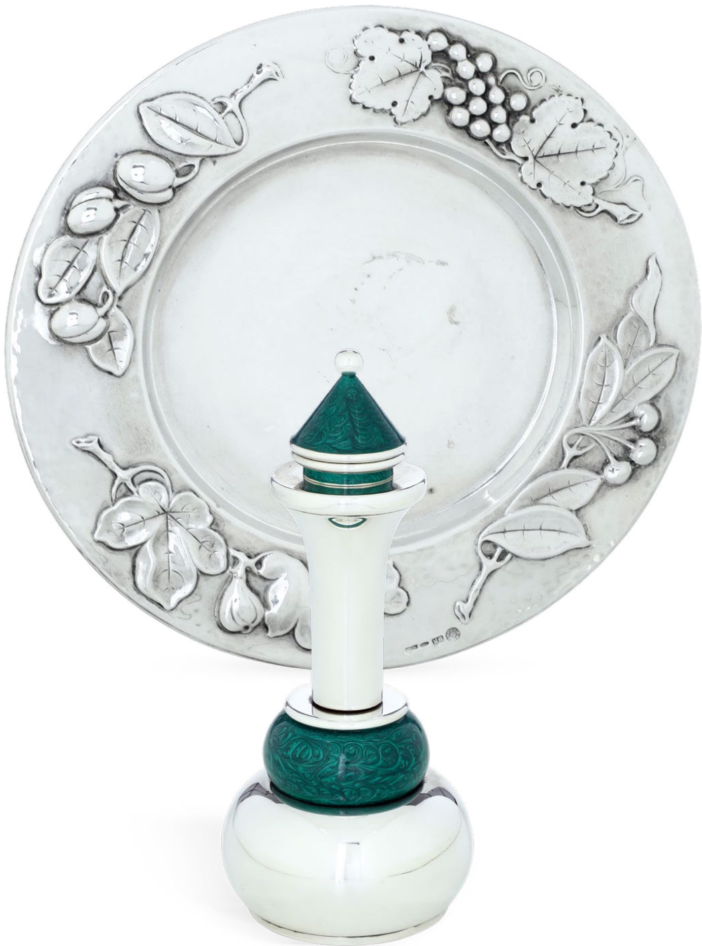
ARGENTI DA COLLEZIONE DEL XX SECOLO