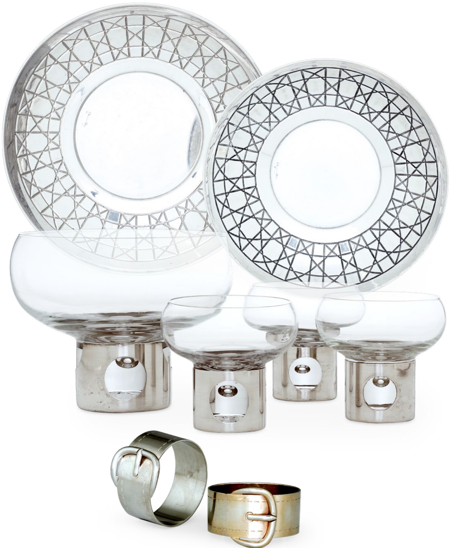
ARGENTI DA COLLEZIONE DEL XX SECOLO