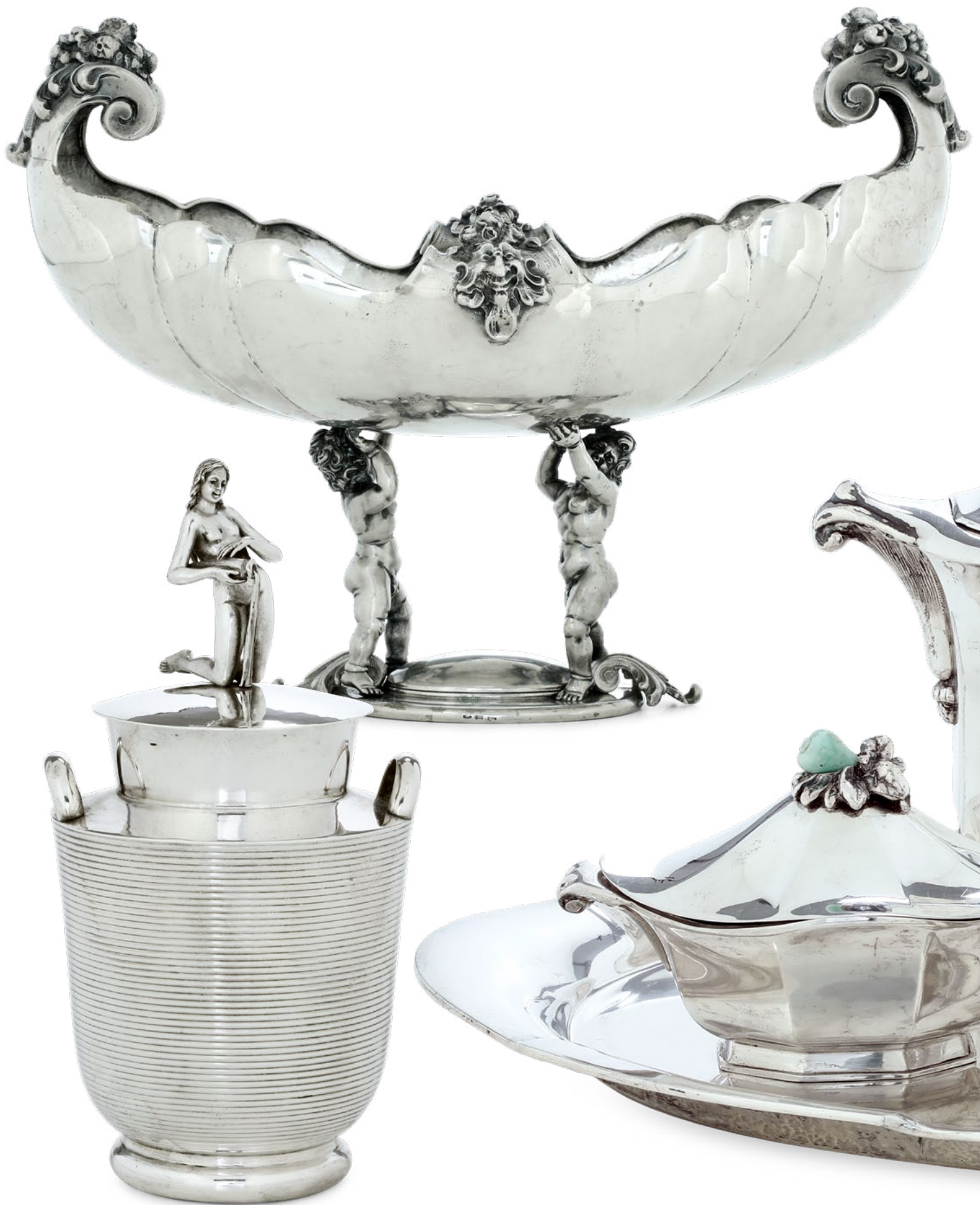
ARGENTI DA COLLEZIONE DEL XX SECOLO